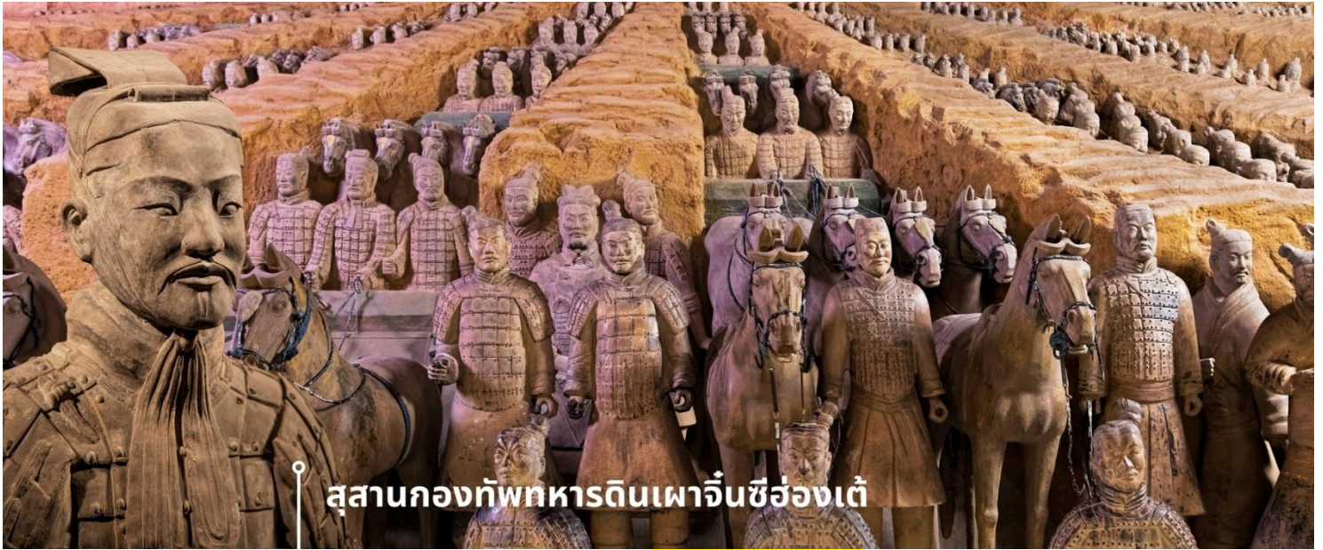
สุสานกองทัพทหารดินเผาจิ้นซีฮ่องเต้

ค้นพบในปี ค.ศ. 1974 โดยชาวนาที่ขุดบ่อน้ำในเขตซื่ออัน มณฑลส่านซี หลังการค้นพบครั้งนั้น การขุดค้นและวิจัยทางโบราณคดีก็เริ่มต้นขึ้น ซึ่งทั้งหมดถูกจัดเรียงอย่างเป็นระเบียบในพื้นที่สุสานขนาดใหญ่ ภายในใช้เป็นสถานที่บรรจุพระบรมศพจิ้นซีฮ่องเต้ รวมไปถึงกองทัพทหารดินเผาที่มีจำนวนมากกว่า 8,000 ตัว แต่ละตัวมีขนาดเท่าคนจริง และยังมีม้าดินเผาอีกกว่า 600 ตัว พร้อมรถม้า และอาวุธต่าง ๆ ความน่าทึ่งอีกอย่างก็คือ ทหารดินเผาแต่ละตัวถูกปั้นขึ้นด้วยมือและมีรายละเอียดแตกต่างกันไป เช่น สีหน้า ทรงผม และเครื่องแต่งกาย ซึ่งสะท้อนยศและบทบาทของแต่ละคนในกองทัพ รวมถึงการเคลือบสีเพื่อให้รูปปั้นคงทนยาวนาน ซึ่งในปัจจุบัน สุสานแห่งนี้มีขนาดใหญ่ พื้นที่มากกว่า 56 ตารางกิโลเมตร ยังมีหลุมฝังศพหลัก และหลุมย่อยอีกมากมายที่ยังไม่ได้ถูกขุดค้น