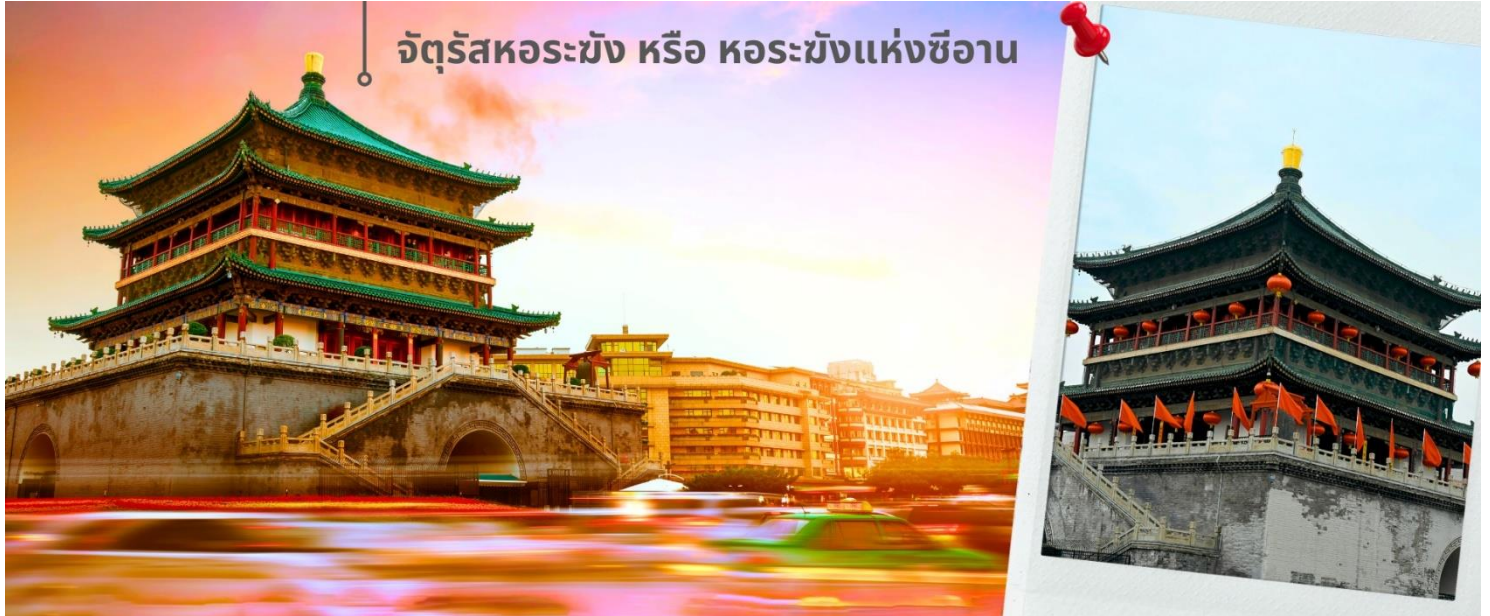
จัตุรัสหอระฆัง หรือ หอระฆังแห่งซีอาน

จากนั้นนำท่านเดินทางเที่ยวชม จัตุรัสหอระฆัง หรือ หอระฆังแห่งซีอาน เป็นหนึ่งในสัญลักษณ์สำคัญของเมืองซีอาน ตั้งอยู่ใจกลางเมือง สร้างขึ้นในปี ค.ศ. 1384 สมัยราชวงศ์หมิง เพื่อใช้ประกาศเวลาและเตือนภัยจากศัตรู ตัวหอสร้างจากไม้ทั้งหลัง มีความสูงประมาณ 36 เมตร โดดเด่นด้วยสถาปัตยกรรมจีนโบราณที่งดงาม และการประดับด้วยลวดลายสีทองและเขียว จัตุรัสแห่งนี้เป็นจุดตัดของถนนสายหลักทั้งสี่สาย สามารถขึ้นไปชมวิวเมืองซีอานแบบพาโนรามาได้ด้านบน