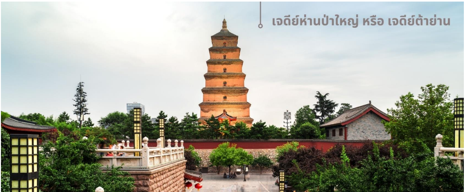
เจดีย์ห่านป่าใหญ่ หรือ เจดีย์ต้าย่าน

จากนั้นนำท่านเที่ยวชม เจดีย์ห่านป่าใหญ่ หรือ เจดีย์ต้าย่าน สถานที่ท่องเที่ยวระดับ 4A อายุมากกว่า 1,300 ปี ตั้งอยู่ในบริเวณวัดต้าฉือเอิน ซึ่งเป็นวัดสำคัญที่พระถังซำจั๋งเคยพำนัก ในตอนใต้ของเมืองซื่ออัน มณฑลส่านซี ตัวเจดีย์สร้างขึ้นใน ค.ศ.652 ในสมัยราชวงศ์ถัง โดยพระถังซำจั๋ง(หรือพระเสวียนจาง) ได้เสนอให้สร้างขึ้นเพื่อเก็บพระคัมภีร์และวัตถุที่ได้นำกลับมาจากชมพูทวีปในช่วงการเดินทางไปแสวงบุญที่อินเดีย เจดีย์ห่านป่าใหญ่มีความสูงประมาณ 64 เมตรในปัจจุบัน หลังผ่านการบูรณะและปรับปรุงหลายครั้ง โครงสร้างของเจดีย์ทำจากอิฐและมีการออกแบบที่เรียบง่ายแต่สง่างาม แสดงถึงสถาปัตยกรรมสมัยราชวงศ์ถัง แต่ด้วยเหตุแผ่นดินไหวในเวลาต่อมา บางส่วนของเจดีย์ถล่มลง ทำให้ปัจจุบันเหลือเพียง