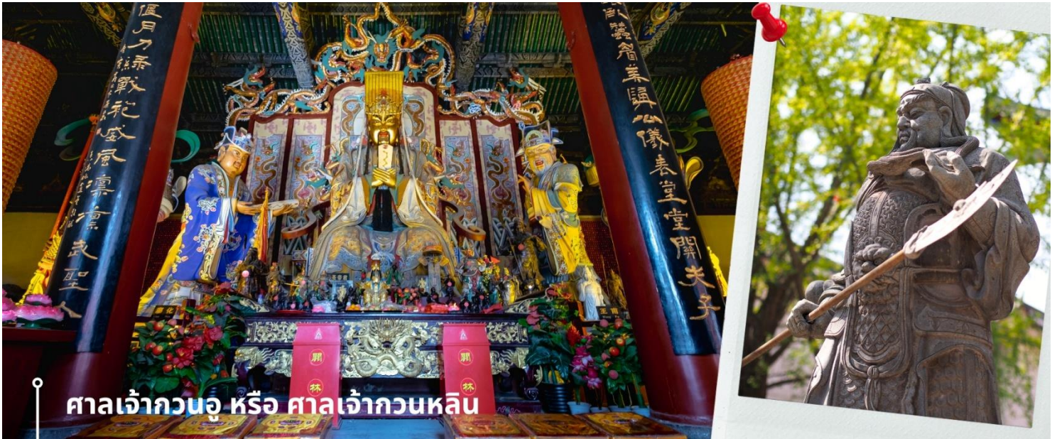
ศาลเจ้ากวนอู หรือ ศาลเจ้ากวนลัน

นำท่านเที่ยวชม เมืองโบราณลั่วอี้ เป็นสถานที่ท่องเที่ยวระดับ 1A ตั้งอยู่ในเมืองเก่าของเมืองลั่วหยาง เมืองหลวงโบราณของราชวงศ์ทั้ง 13 ราชวงศ์ บรรยากาศคอบอบวลไปด้วยเสน่ห์แบบจีนโบราณ ที่ยังคงอยู่มายาวนานหลายร้อยปี เมื่อเดินเล่นผ่านเมืองโบราณลั่วอี้ จะเห็นสถาปัตยกรรมบ้านเรือน ที่มีชายคาซ้อนกันเป็นชั้นๆ และกำแพงเมือง สนามหญ้า