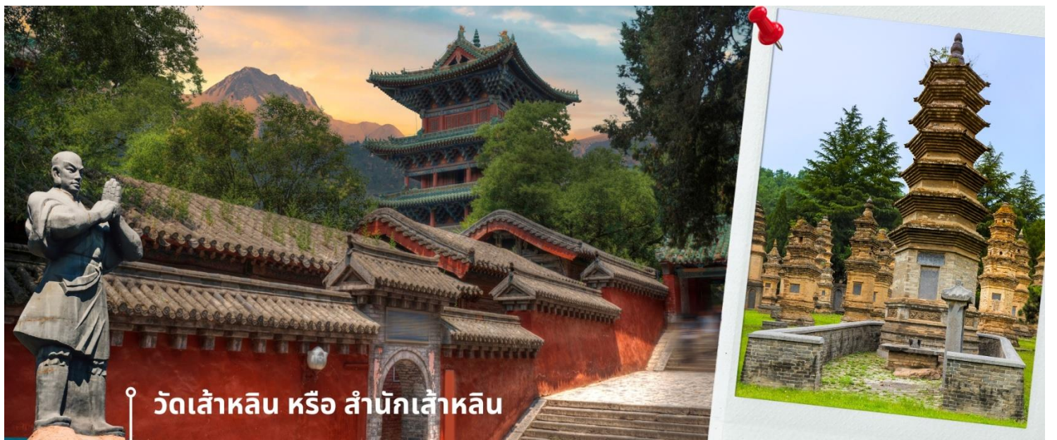
📍 วัดเส้าหลิน หรือ สำนักเส้าหลิน

นำท่านชม ปาเจติย์ หรือ ถ้ำหลิน ซึ่งมีอยู่ราว 230 ที่มีความเก่าแก่ เป็นสถานที่ศักดิ์สิทธิ์ที่ตั้งอยู่ภายในบริเวณวัด ซึ่งเป็น