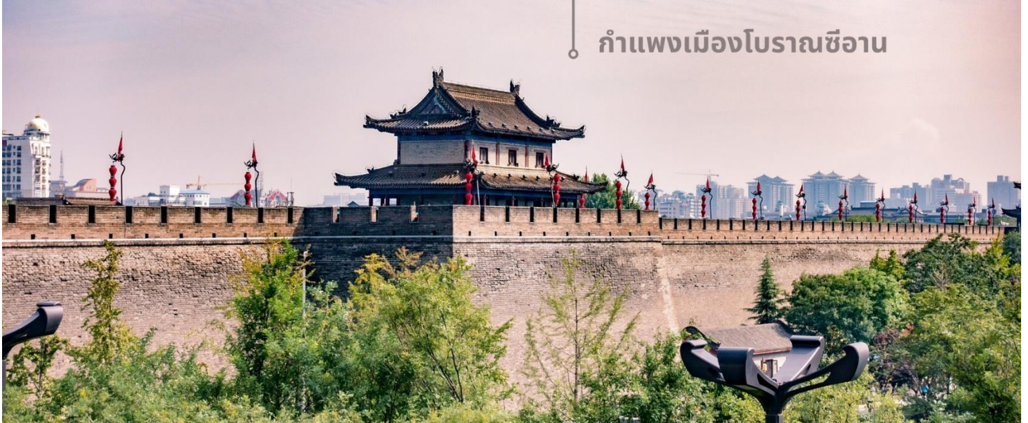
กำแพงเมืองโบราณซีอาน

จากนั้นนำท่านเที่ยวชม กำแพงเมืองโบราณซีอาน เป็นหนึ่งในกำแพงเมืองโบราณที่สมบูรณ์ที่สุดในประเทศจีน สร้างขึ้นในยุคราชวงศ์หมิง (ประมาณปี ค.ศ. 1370) ปัจจุบันมีอายุเก่าแก่กว่า 654 ปี มีความยาวประมาณ 13.7 กิโลเมตร ล้อมรอบใจกลางเมืองซีอาน ซึ่งเคยเป็นเมืองหลวงในยุคโบราณ กำแพงมีความสูง 12 เมตร และกว้างราว 12-15 เมตร มากพอสำหรับการเดินเล่นหรือขี่จักรยานชมวิวดูได้เลยทีเดียว นอกจากนี้ยังมีหอคอยและประตูเมือง 4 ด้านที่น่าประทับใจ