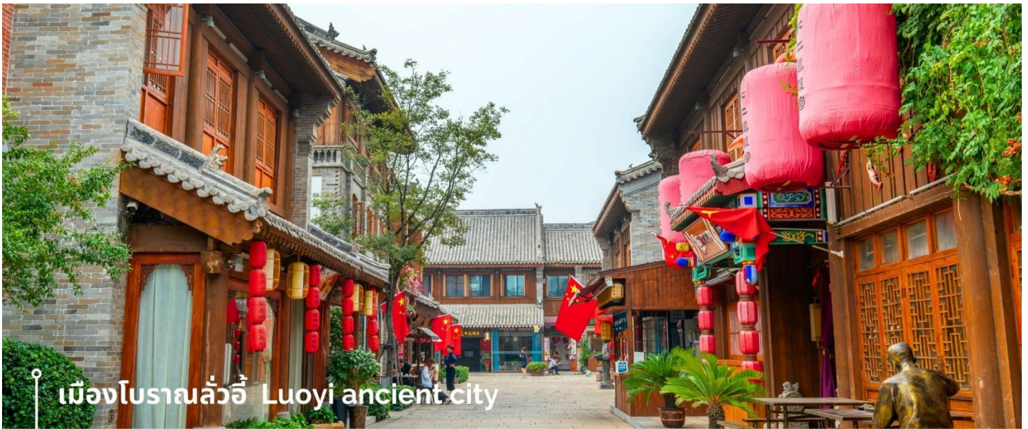
เมืองโบราณลั่วอี้ Luoyi ancient city

นำท่านเที่ยวชม เมืองโบราณลั่วอี้ เป็นสถานที่ท่องเที่ยวระดับ 1A ตั้งอยู่ในเมืองเก่าของเมืองลั่วหยาง เมืองหลวงโบราณของราชวงศ์ทั้ง 13 ราชวงศ์ บรรยากาศคอบอบวลไปด้วยเสน่ห์แบบจีนโบราณ ที่ยังคงอยู่มายาวนานหลายร้อยปี เมื่อเดินเล่นผ่านเมืองโบราณลั่วอี้ จะเห็นสถาปัตยกรรมบ้านเรือน ที่มีชายคาซ้อนกันเป็นชั้นๆ และกำแพงเมือง สนามหญ้า