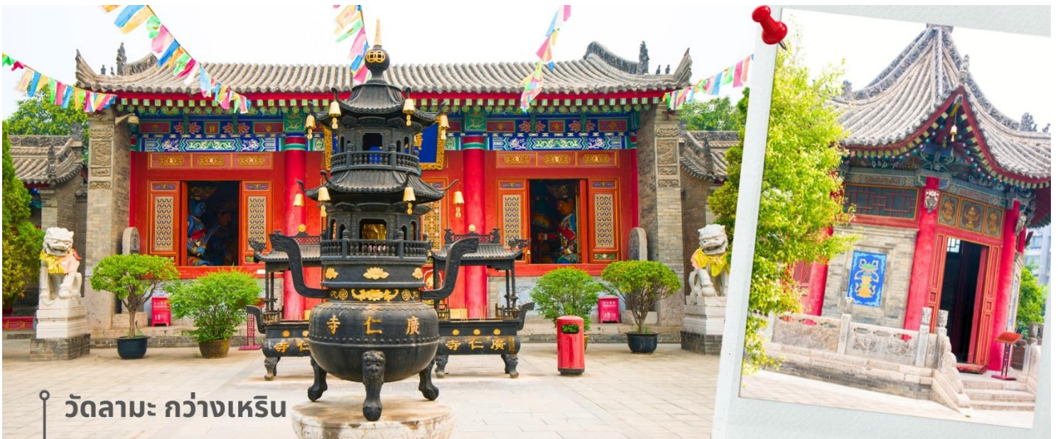
วัดลามะ กว้างเหริน

จากนั้นเดินทางต่อไปยัง วัดลามะกว้างเหริน เป็นวัดลามะแห่งเดียวในซีอาน สร้างขึ้นในปี ค.ศ.1705 ช่วงราชวงศ์ชิง เพื่อรองรับลามะจากทิเบตที่เดินทางมาพักแรมและประกอบพิธีกรรมทางศาสนา จุดเด่นของวัดคือสถาปัตยกรรมที่ผสมผสานสไตล์จีนและทิเบตอย่างงดงาม ภายในมีพระพุทธรูปและภาพจิตรกรรมฝาผนังที่วิจิตร รวมถึง "หอสมุดทิเบต" ซึ่งรวบรวมตำราทางพุทธศาสนาแบบทิเบตไว้ นักท่องเที่ยวสามารถสัมผัสบรรยากาศที่เงียบสงบและเรียนรู้เกี่ยวกับวัฒนธรรมทิเบตได้ที่นี้