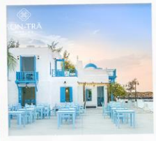
ซานตารีน่าคาเฟ่