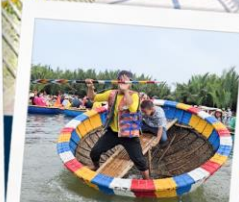
เรือกระดัง