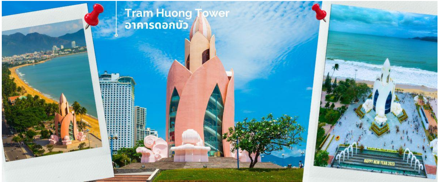
Tram Huong Tower อาคารดอกบัว

นำท่านชม ชายหาดเมืองญาจาง และ Tram Huong Tower อาคารดอกบัว เป็นสัญลักษณ์ของเมืองญาจาง ซึ่งมีส่วนส่งเสริมภาพลักษณ์ของเมืองชายฝั่งให้กับนักท่องเที่ยวทั้งในและต่างประเทศ ตัวอาคารมีจุดเด่นเป็นสถาปัตยกรรมจำลองรูปทรงดอกบัวที่สวยงาม เป็นอีกหนึ่งแลนด์มาร์คที่อยู่บนหาดญาจาง