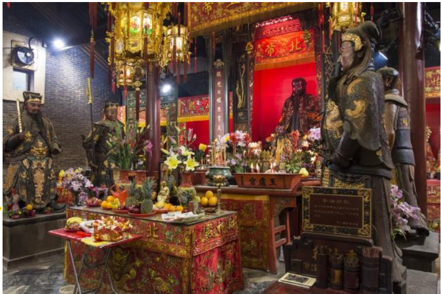
เสริมอำนาจ เสริมบารมี ที่ วัดกวนไท (Kwan Tai Temple) หรือ

Highlight! เสริมโชคกลางให้แน่น นำความรุ่งเรืองมาสู่ชีวิต