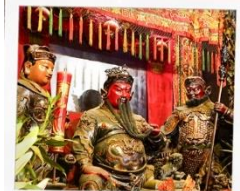
เทพเจ้ากวนอู วัดกวนไท