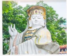
เจ้าแม่กวนอิมรพหลัสนีย์