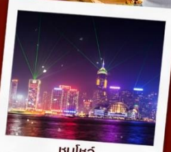
ชมโชว์ SYMPHONY OF LIGHT