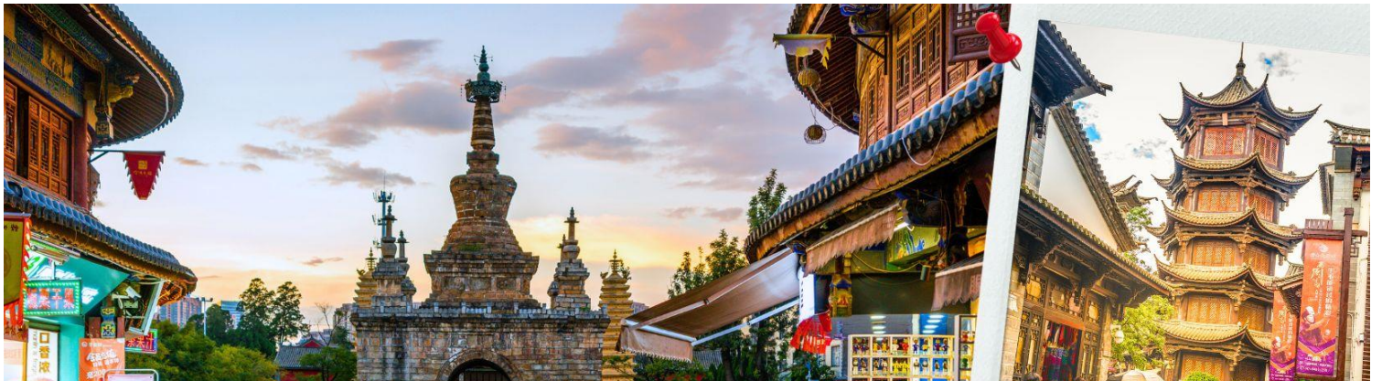
ประตูม้าทองไก่หยก Golden Horse Jade Cock Gate

นำท่านชมบรรยากาศ เมืองโบราณกวนตุ๋ (Guandu Old Town) เป็นหนึ่งในต้นกำเนิดของวัฒนธรรมยูนนาน และยังถือเป็นหนึ่งในภูมิทัศน์ทางประวัติศาสตร์และวัฒนธรรม ที่สำคัญของเมืองคุนหมิง เมืองโบราณแห่งนี้ยังคงเป็นศูนย์กลางทางการค้าและคมนาคมที่สำคัญ ในอดีตเคยเป็นหมู่บ้านชาวประมงในสมัยราชวงศ์ถัง เมืองกวนตุ๋ยังเป็นเมืองแรกๆ ที่ศาสนาพุทธทางนิกายตันตระได้เริ่มเผยแพร่เข้ามาในดินแดนยูนนาน