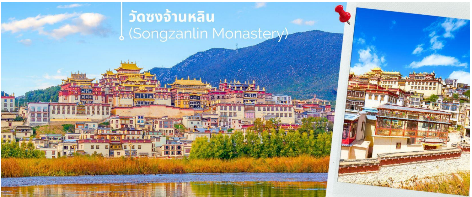
วัดซงจ้านหลิน (Songzanlin Monastery)

นำท่านชม วัดซงจ้านหลิน เป็นวัดลามะที่ใหญ่ที่สุดของมณฑล ยูนนานทางภาคตะวันตกเฉียงใต้ของจีน ถูกสร้างขึ้นในปีค.ศ.1679 อยู่ห่างจากตัวเมืองเซี่ยงไฮ้ 5 กิโลเมตร วัดนี้เป็นอีกหนึ่งสถานที่ท่องเที่ยวที่สำคัญของเมืองเซี่ยงไฮ้ ประเทศจีน ถ้ามาเที่ยวเซี่ยงไฮ้แล้วไม่ได้แวะมาวัดซงจ้านหลินก็ถือว่ายังไม่ถึงเซี่ยงไฮ้ ด้านนอกวัดสามารถถ่ายรูปได้ แต่ภายในอาคารวัดห้ามถ่ายรูป