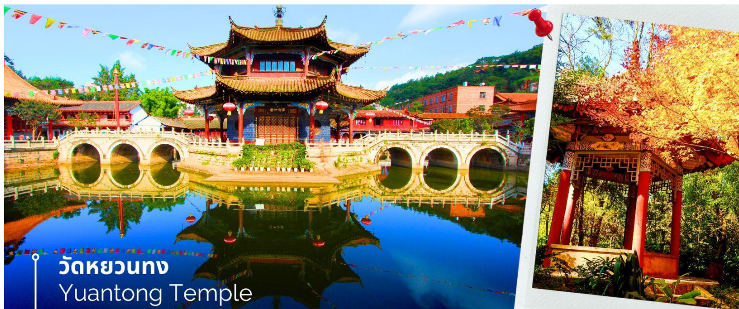
วัดหยวนตง Yuantong Temple

นำท่านชม วัดหยวนตง (Yuantong Temple) วัดแห่งนี้เป็นวัดที่ใหญ่และเก่าแก่ที่สุดในเมืองคุนหมิง สร้างมาตั้งแต่สมัยราชวงศ์ถัง มีอายุยาวนานประมาณ 1,200 กว่าปี การสร้างวัดแห่งนี้จะแปลกตากว่าวัดอื่นในจีน