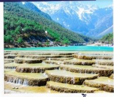
ทะเลสาบธารน้ำขาว รวมรถแมคเคเตอร์รี่