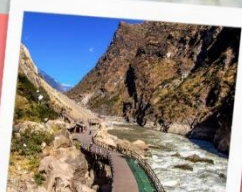
ช่องแคบเสือกระโจน รวมบันไดเลื่อน ขึ้น-ลง