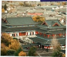
เมืองเก่าลี่เจียง