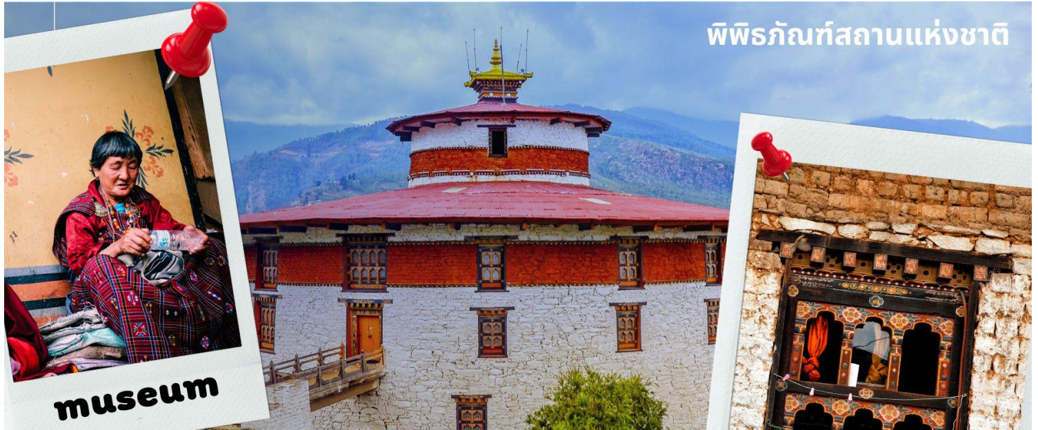
พิพิธภัณฑ์สถานแห่งชาติ

เที่ยง รับประทานอาหารเที่ยง ณ ภัตตาคาร (มื้อที่ 1)