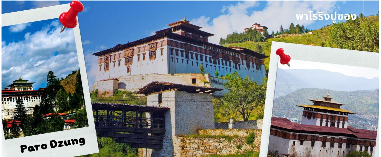
พาโรริงปูซง

นำท่านเดินทางไม่ไกล ชม พิพิธภัณฑ์สถานแห่งชาติ พิพิธภัณฑ์แห่งนี้เป็นที่เก็บรวบรวมหน้ากากศิลปะแบบพุทธมหายาน นิยายต้นตระกูล ภาพพระบฏ อวูธ เหริยฤทษยาปณ์ เครื่องมือเครื่องใช้ไม้สอยต่างๆ รวมถึงจัดแสดง ความหลากหลายทางธรรมชาติอันสมบูรณ์ของประเทศเพื่อให้ทุกท่านได้รู้จักภูฏานมากขึ้น ตรงข้ามกับอาคารพิพิธภัณฑ์ เป็นอาคารทรงกลมสีขาว เรียกว่า ตาซอง (Ta Dzong) หรือ หอคอย เดิมใช้เป็นหอสังเกตการณ์ข้าศึกศัตรูเนื่องจาก สร้างอยู่บนเนินสูง สามารถมองวิวตัวเมืองพาโรได้โดยรอบ