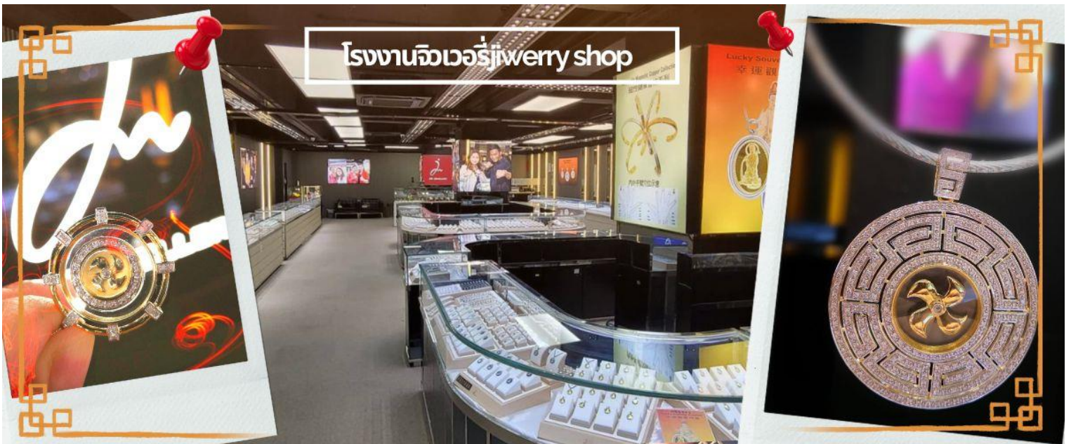
โรงงานจิวเวอรี่jewery shop