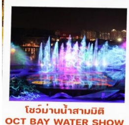
โชว์ม่านน้ำสามมิติ OCT BAY WATER SHOW