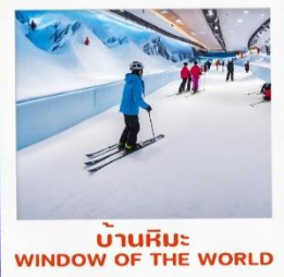
บ้านหิมะ WINDOW OF THE WORLD