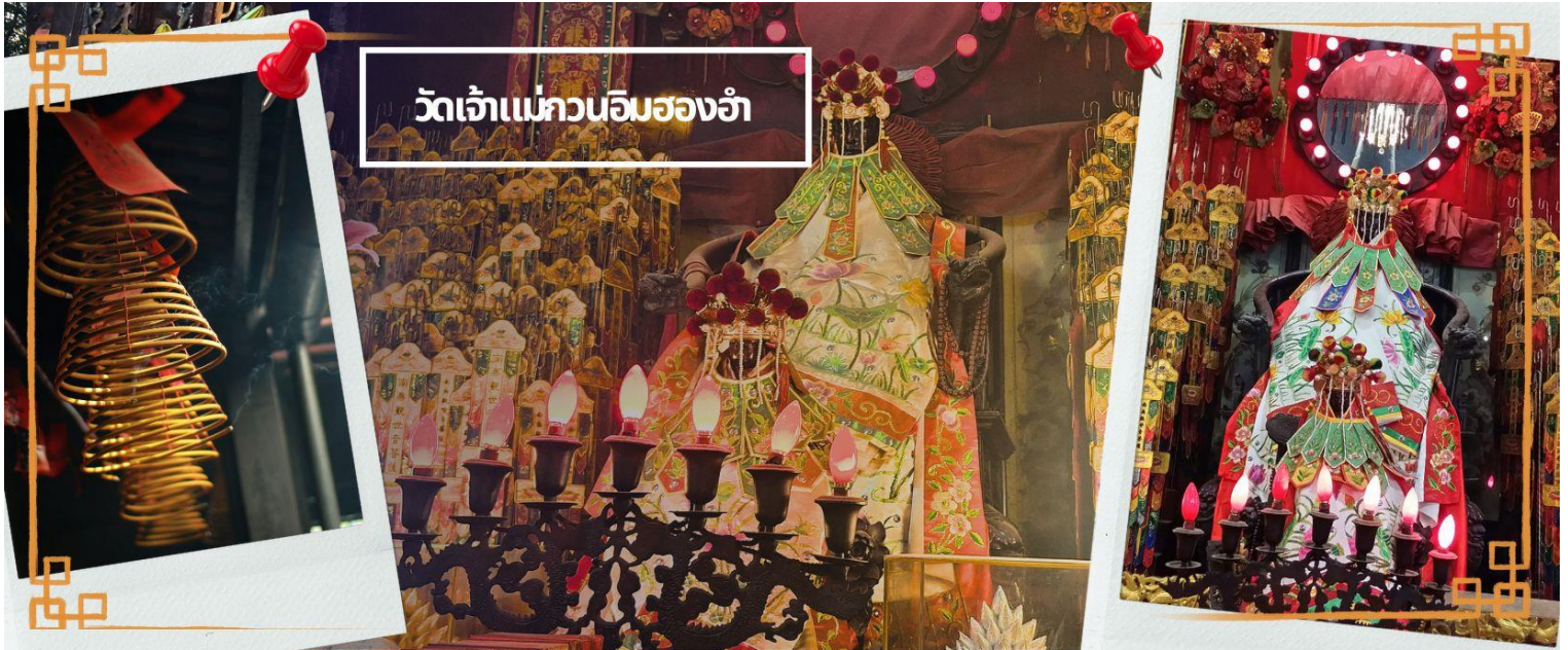
วัดเจ้าแม่กวนอิมจงอ่า

จากนั้นนำท่านชม โรงงานจิวเวอรี่ ซึ่งเป็นโรงงานที่มีชื่อเสียงที่สุดของฮ่องกงในเรื่องการออกแบบเครื่องประดับ อาทิเช่น จี้ และแหวนกำหั้น ที่สวยงามโดดเด่นไม่เหมือนใคร ซึ่งถือกำเนิดขึ้นที่นี่และมีชื่อเสียงที่สุดใช้เป็นเครื่องประดับติดตัว และเสริมดวงชะตา สินค้าทุกชิ้นมีเอกสารรับประกันคุณภาพเปลี่ยน ซ่อม ได้ตลอดอายุการใช้